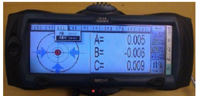
Med snabbfunktioner kan man lätt anpassa displayen

Psion NetPad har inget hårt tangentbord. Däremot finns tre hårda navigeringstangenter som i GEPOC kan liknas vid GAS, BROMS och RATT på en bil. Det är i huvudsak med dessa som man kör systemet i fält. Med gasen fortsätter man hela tiden i programmet, med bromsen avbryter man en sekvens och med ratten, som har fyra pilar, kan man navigera ibland rullgardinsmenyer och grafiska displayer. Allt är anpassat att kunna köras med tumvantar i köldgrader och ruskväder.