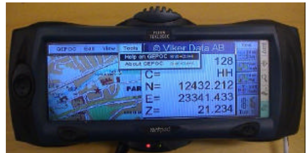
Från huvudmenyn når man den inbyggda manualen.

För att göra uppstart och inställningar mm. kan man använda pekskärmen antingen direkt med fingertopparna, eller med medföljande penna. Grafikfönstret kan användas till kombinationer av rasterbilder, vektorgrafik och guidningsgrafik. På GEODOS-vis kan man enkelt och snabbt växla mellan olika presentationsmöjligheter.