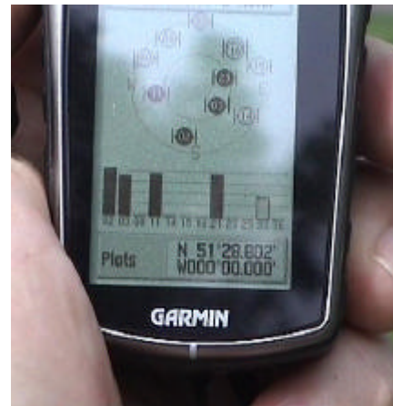
Garmin Etrex Vista på utflykt

Som GPS-mottagare rekommenderar vi idag Garmins Etrex VISTA. Vår erfarenhet är att den med råge lever upp till sina noggrannhetsspecifikation. I kombination med vårt GEODOS på Psion Workabout blir det ett oslagbart system vad gäller pris/prestanda. Vårt senaste projekt går ut på att mäta vattenströmning (inte strömning). Det handlar om forskning för fiske.