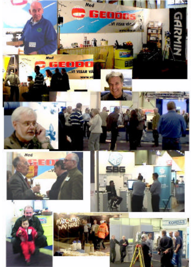
Trång och trevligt på mässan. Bilderna talar för sig själva.