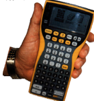
..... Första bilden på Workabout 1994

"Gamla" Psion Workabout tillverkas och produceras som aldrig förr. Efterfrågan och produktionstakten är f.n. c:a 80.000 enheter/år. Operativsystemet är fortfarande trygga stabila EPOC från Symbian. Geodos-programmet uppdateras och underhålls kontinuerligt. Inte dåligt för en produkt som fyller 10 år. Det finns ännu inga planer på att lägga ner tillverkningen, så det är ett mycket tryggt köp även för framtiden.