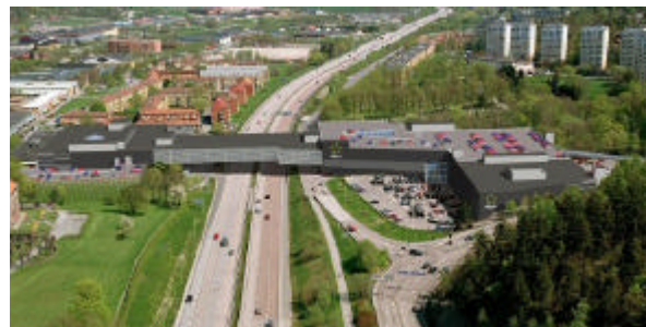
Så här kommer Allum köpcenter i Partille att se ut till våren.

Sammanlagt handlar det om c:a 50.000 m2 butiksytta fördelat på c:a 100 butiker. Det är Sten&Ström Sverige AB som bygger i samarbete med Partille kommun.