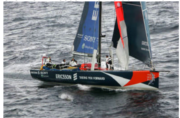
Ericsson har problem med kölkonstruktionen.

Ericsson blev tvungen att vända och segla tillbaka till Sydafrika p.g.a problem med den justerbara kölen. Istället för segling, blev det transport till Melbourne för att fortsätta seglingen från etapp 3 Etapp 2 vanns av Ambro One igen. När Du läser detta är båtarna förmodligen på väg mot Brasilien och vidare så småningom till slutmålet i Göteborg. Under tiden seglar Ostindiefararen Göteborg sakta mot Kina. När jag skriver detta har de just passerat Stenbockens vändkrets, där solen just har vänt och är tillbaka på väg mot oss här i norr. Följ allt detta via www.viker.se