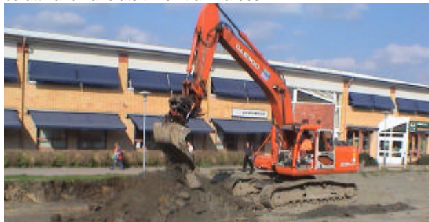
Grävmaskinerna flyttar massor hit och dit hela tiden.

Det är f.n. svårt att beskriva vägen till vårt kontor. Den förflyttas nämligen från dag till dag. Så kommer det att vara ända till våren, då allt ska vara klart. En stor djup grop utanför vår dörr, kommer då att ha förvandlats till en trafikkarusell.