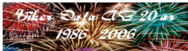
TACK SKMF för den fina födelsedagspresenten !

Alla har ju en exakt födelsedag. Så här ser det ut hos oss. Konstituerande stämma hölls den 5 mars 1986. Registrerade för moms blev vi 1 april 1986. Själva födelsedagen anser vi vara den dag då vi officiellt blev registrerade hos Patent- och registreringsverket, (numera Bolagsverket). Det var den 8 april 1986. Det passar ju bra att fira vid GIT-mässan på Elmia i Jönköping 22-24 mars 2006