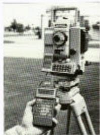
Et komplett svenskt programpaket för modern mätning och utställning