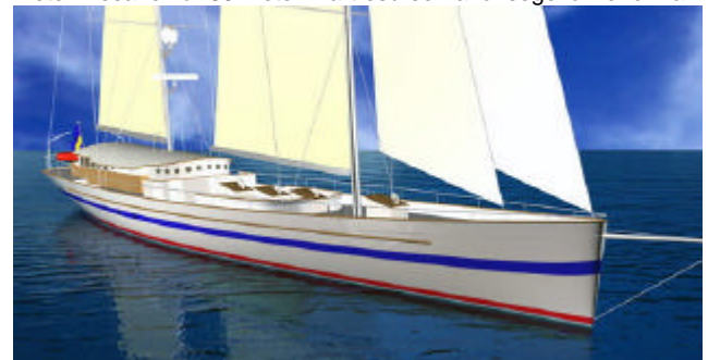
Elida V har 60 kojplatser och tar 150 passagerare.

Den 1 maj 2006 planeras sjösättningen av denna unika segelbåt. Lagom för att ta emot jorden runt seglarna som ju går i mål 17 juni i Göteborg. ElidaV är något alldeles extra och helt unikt. Hon är byggd med samma skrovlinjer som de snabbaste tävlingsbåtarna Skillnaden är att hon är hela 40 meter lång. Stormasten mäter 45 meter Mesanen är 33 meter. Fartresurserna för segel blir enorma.