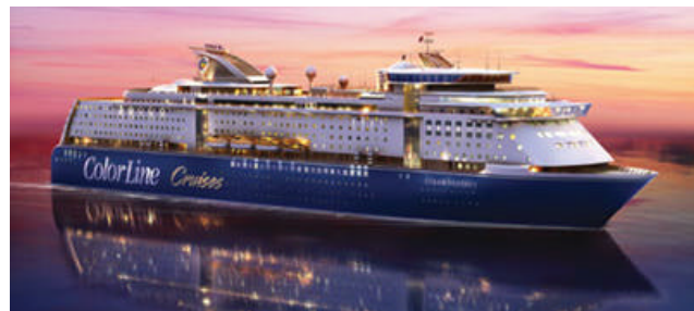
Lyxfärjan Color Fantasy bjuder på stimulerande konferensmiljö

Det var många intressanta föredrag att lyssna till under två dagar med fullspäckat program från morgon till sen kväll. Precis som i Sverige har vi massor av nöjda kunder i Norge. Drygt 100 av dessa mötte traditionsenligt upp för att utbyta erfarenheter under