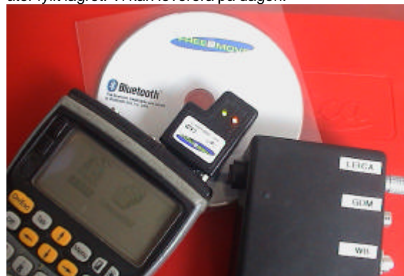
Bluetooth/RS232-Kit för bl.a. fjärrstyrning av totalstationer.

Förra året tog vi tillsammans med företaget Free2Move i Halmstad, fram nya generation av Bluetooth-pluggen för RS232-kommunikation. Den är försedd med praktiska lysdioder och kan anslutas direkt till 12V. Första upplagan tog fort slut, men nu har vi åter fyllt lagret. Vi kan leverera på dagen.