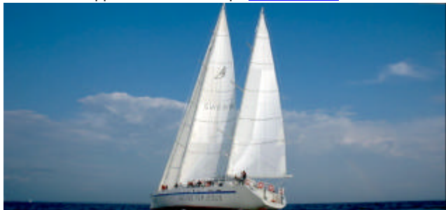
Mot målet i Marstrand för fulla segel

För Dig som också vill uppleva riktig segling finns möjligheter till det. Den 20 september disponerar vi ElidaV hela dagen. Se programmet på www.viker.se och anmäl Ditt intresse. Det finns c:a 40 platser. Vi kommer bl.a. att visa GARMIN GPS på båten.