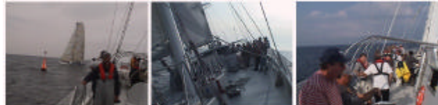
Rundningen vid boj 2 tillsammans med vinnarbåten HiQ var en helt enastående upplevelse. Se video på www.viker.se

Den 11 augusti blev dock jungfruseglingen äntligen av på ett verkligt tufft sätt. Första segelsättningen var på startlinjen till Göteborg Ocean Race med 35 mans besättning. Visserligen dryga två timmar efter de övriga sexton medtävlande båtarna, och därför utanför själva tävlingen. Men det tog bara tolv timmar innan vi i gryningen var i kapp huvudklungan ute vid Skagens rev.