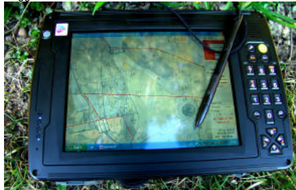
Bilden är tagen utomhus i fullt solsken med klarblå himmel.

Det blev en naturlig koppling till smålänningen Carl von Linné till vars minne vi firade 350 år och som slutade sina dagar i Uppsala. Vid föreläsningen används och presenteras nedanstående "ruggade" Tablet-PC. Den heter Twinhead T8N.