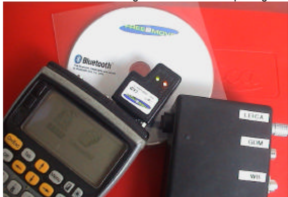
Bluetooth/RS232-Kit för bl.a. fjärrstyrning av totalstationer.

För tre år sedan tog vi tillsammans med företaget Free2Move i Halmstad, fram nya generation av Bluetooth-pluggen för RS232-kommunikation. Den är försedd med praktiska lysdioder och kan anslutas direkt till 12V. Första och andra upplagan tog fort slut, men vi har fortsatt alltid i lager och kan leverera på dagen.