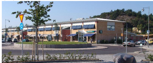
Vårt kontor i det spännande Partille Centrum

Tillsammans med Geograf och Trimble tar vi nu åter upp en gammal Geodos-tradition. Många minns säkert våra träffar på torsdagseftermiddagarna för något tiotal år sedan. Jag behöver kanske bara nämna «Bittans soppa» Tanken är att skapa ett forum där mätfolk från olika företag, kommuner, myndigheter etc. kan träffas och utbyta erfarenheter och information under trevliga former.