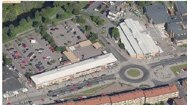
Utsnitt från Eniros kartfunktion «UTSIKT»

I Sommaren 2007 stod det klart, vårt nya kulturcentrum i Partille. Men på Eniros nya kartfunktion «Utsikt» som släpptes för några veckor sedan har bygget just startat. Man ser kranar och arbetsbodar men ännu ingen byggnad. Näväl det är tur att verkligheten gäller och inte den virtuella världen. Kulturum ligger mindre än ett stenkast från vårt kontor. Redan har vi kunnat njuta av välkända artister som Lasse Kronér, Maria Lundkvist, Svante Turesson m.fl.