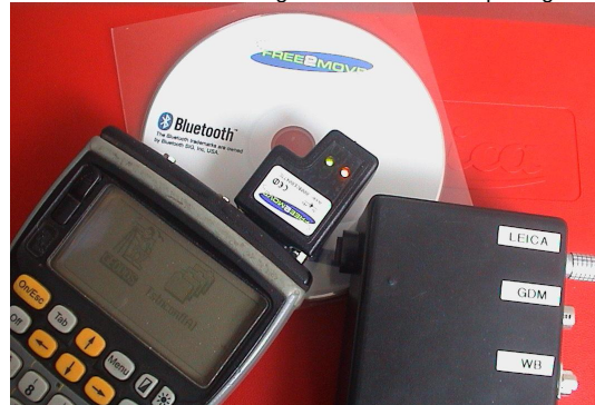
Bluetooth/RS232-Kit för bl.a. fjärrstyrning av totalstationer.

För tre år sedan tog vi tillsammans med företaget Free2Move i Halmstad, fram nya generation av Bluetooth-pluggen för RS232-kommunikation. Den är försedd med praktiska lysdioder och kan anslutas direkt till 12V. Första och andra upplagan tog fort slut, men vi har fortsatt alltid i lager och kan leverera på dagen.