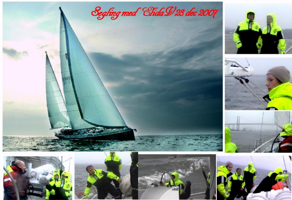
Bilderna är från en segling den 28 dec 2007 i kuling och ösregn.

En ny tradition har tagit sin början. Förra året den 30 maj var första gången som vi kunde använda ElidaV för att sprida information. Tyvärr blev de flesta då kvar vid kaj av olika anledningar. Även Elida. Vi var bara tre som trotsade vådrets makter. Men i år kommer det att bli segla av på riktigt. Under seglingen finns tillfälle att bekanta sig med vårt GPS-sortiment i dess rätta miljö.