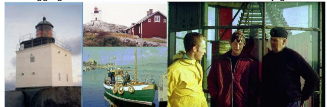
En fin tid då arbetet innehöll mycket naturupplevelser och äventyr.

Många har frågat efter denna lilla avdelning, så jag har grävt lite och hittat följande bilder. Det är 40 år sedan. Det handlar om vinkel- och avståndsmätning i Sveriges huvudtriangelnät 1967 Triangeln heter Ytteristlarna i Göteborgs södra skärgård. På den tiden bodde fyrvaktare därute, och det är han som släpper in oss i fyren. Har ni försökt sova i en fyrantennin vars lysvidd är 18 nautiska mil (34km) och vars generator drivs av ett dieselaggregat som dånar i det stora tomma huset. Det har jag.