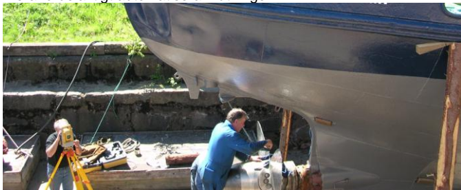
Mätning av gammal bogserbåt i Sjötorp vid Vänern

Sjöfartsverket har sedan många år använt GEODOS för fartygsmätning och stabilitetskontroll. Instrumentparken har uppdaterats regelbundet. Numera använder man Leicas 1200-serie. Förbättrad prismales mätning har gjort det möjligt att ännu mera fördelaktigt automatisera mätningen.